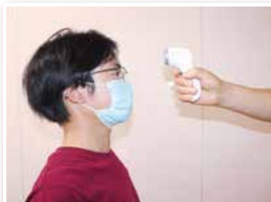
面会者入口では非接触型体温計で検温しています

今回ご紹介した感染対策を含め、当院で行っている取組をウェブサイトでもご紹介しております。