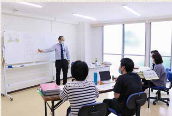
指導医による講義の様子

指定研修機関は全国に319機関、静岡県では当院を含めて13機関（令和4年3月現在）です。当院は地域の基幹病院であり、救急医療の維持、高度・専門医療の提供、地域医療連携の推進を使命としています。急性期から在宅医療まで、医療と看護の充実は喫緊の課題です。さらに静岡県は人口10万人当たりの医療施設従事医師数が低く、特に富士医療圏においては顕著です。そのため院内のみでなく近隣の医療施設においても、看護の視点だけでなく医療の視点を持つ看護師の活躍が期待されます。