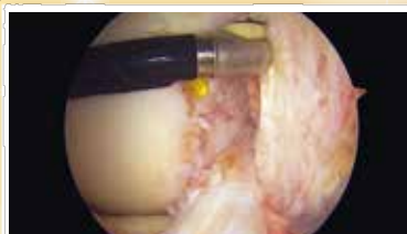
還流液を流しながら手術をしているところ

骨折治療に関節鏡を併用することで、より正確な関節面の整復を得ることも可能となります。また、変形性膝関節症に対し従来は保存療法で疼痛が改善しない場合は人工関節手術が行われてきましたが、関節鏡を併用した膝周囲骨切り術も行えるようになりました。