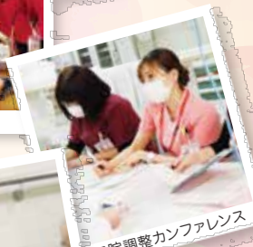
退院調整カンファレンス