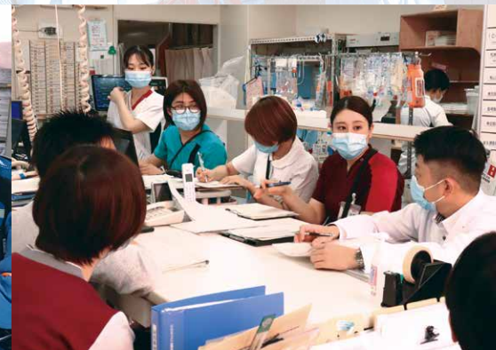
●退院支援カンファレンスの様子