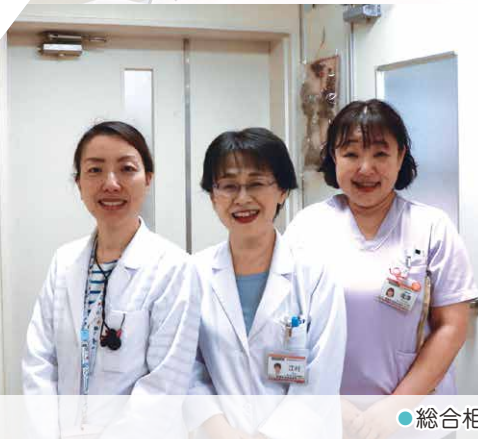
●総合相談室スタッフ