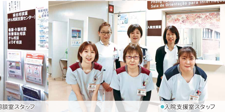
●入院支援室スタッフ