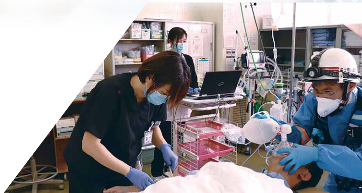
●救急外来での処置の様子