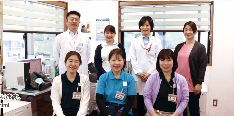
●訪問看護・退院調整スタッフ