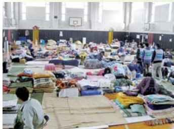
(避難所の小学校の様子)

続いて、岩手県から静岡県への継続的な医療救護支援要請による県内各市への派遣依頼を受け、当院では医師1名、看護師2名、薬剤師1名、事務員1名、計5名による医療救護チームを2チーム組織し、岩手県宮古市へそれぞれ5月5日～9日と5月11日～15日に派遣し、支援活動を行いました。宮古市では救護所において避難住民などの一般・慢性期医療、そして周辺の診療所などの