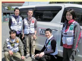
(医療救護班のメンバー)

翌日以降は宮古市の南東に位置する重茂(おもえ)半島へ赴き、半島にある診療所で診療を行いました。ここでは交通手段がなく、外出が困難で診療所へ行けない患者さんもいて、希望により往診も行いました。地震発生から2か月近く経っているということもあり、症状は大分落ち着いてきているようで、重病の方はいなかったものの、長期の避難所暮らしで血圧が高くなったり、体調を崩す方などが見受けられました。