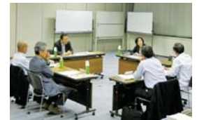
(あり方懇話会の様子)