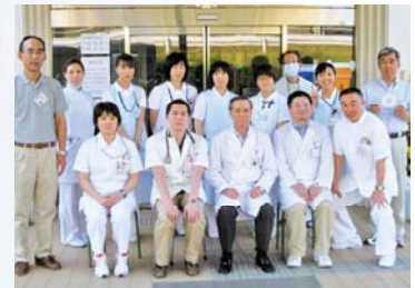
(本吉病院職員との集合写真)