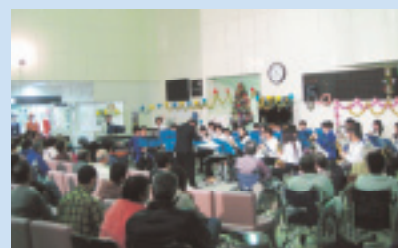
昨年の院内コンサートの様子

市内で広く活躍されている、“元吉原ウインドアンサンブル”のみなさんの演奏をぜひお聴きください。