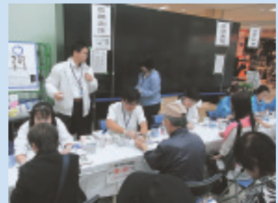
昨年の糖尿病キャンペーンの様子