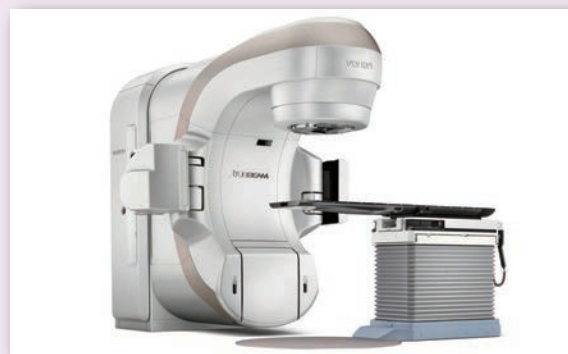
高精度放射線治療装置 Truebeam (令和7年11月稼働開始)