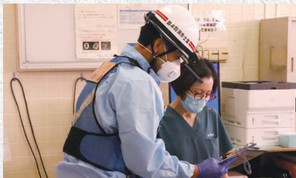
救急外来にて救急隊と当院医師の情報共有

訓練内容: 救急医療用ヘリコプター(ドクターヘリ)で運ばれてきた首都圏の重症患者を消防救急車にて富士市防災ヘリポート(八代町)から当院へ搬送