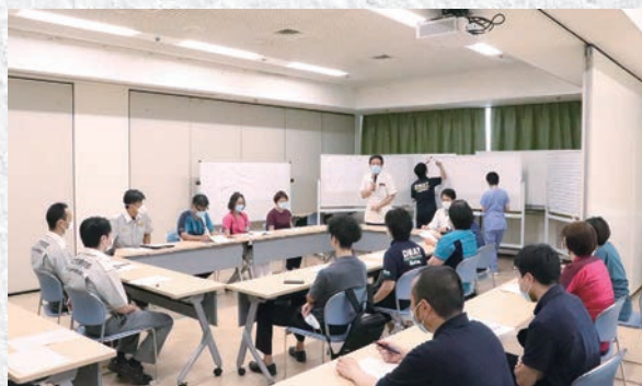
救急隊とともに検証会実施