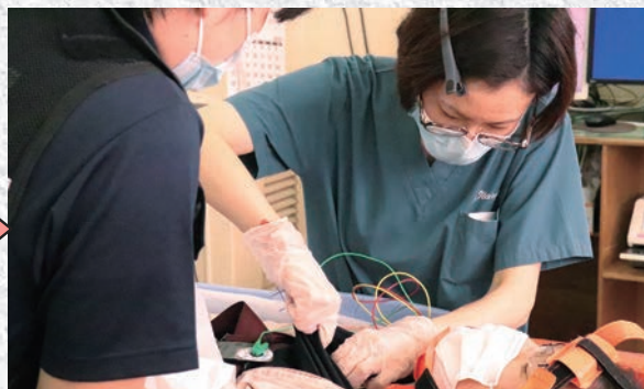
救急外来にて医師・看護師による対応開始