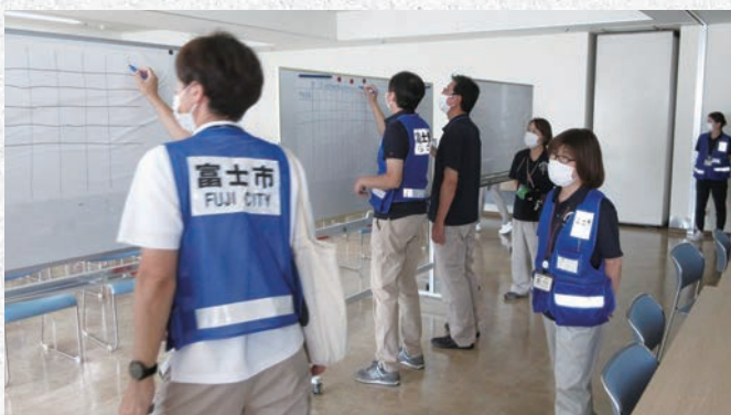
院内情報収集(優先搬送患者を決定)