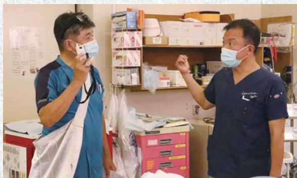
救急外来スタッフから病棟スタッフへ患者受入の連絡