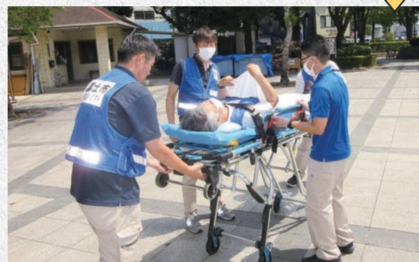
中央公園内ヘリポートに到着