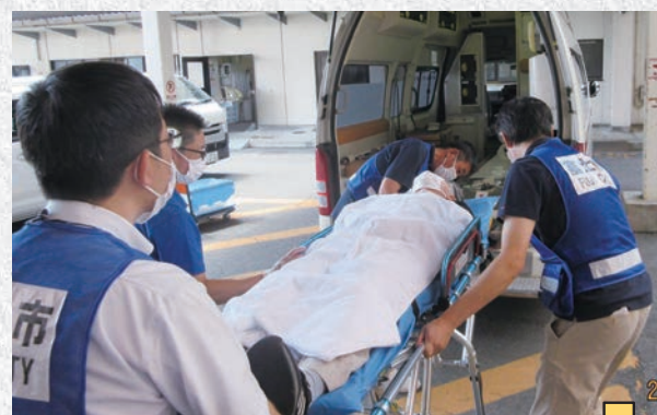
中央公園内ヘリポートへ患者搬送開始

訓練内容: 病院救急車にて当院入院中の重症患者を中央公園(芝生広場)内のヘリポートへ搬送